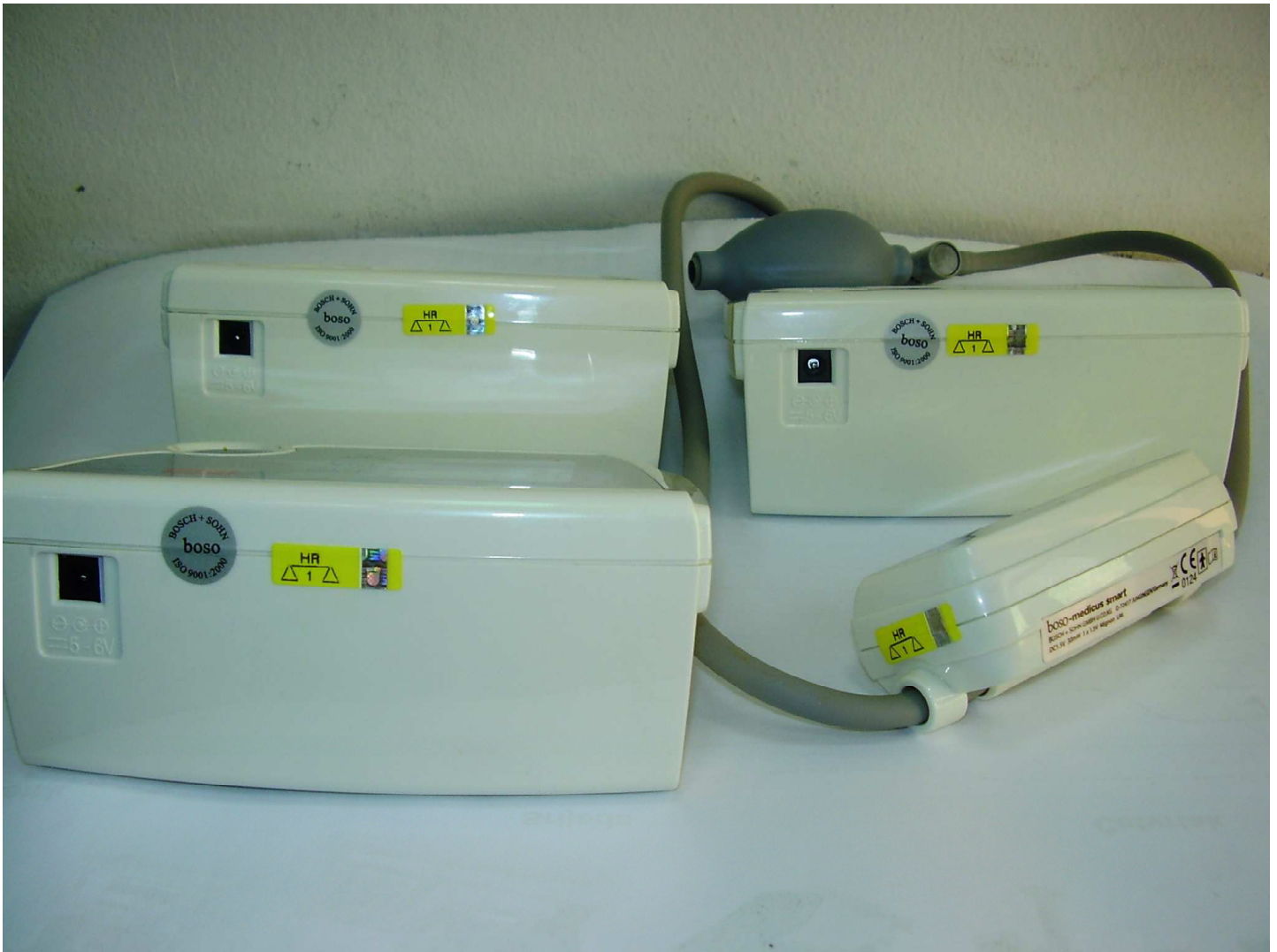
Ovjerni žig u obliku naljepnice